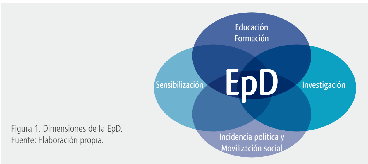
Figura 1. Dimensiones de la EpD.

Este aprendizaje se conforma a través de cuatro dimensiones, interrelacionadas entre sí, tal y como muestra la Figura 1.