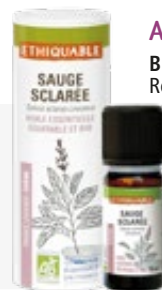
Aceite esencial SALVIA SCLAREA 10 ml BIO JUSTO 100% puro y natural. Ref. 80808101