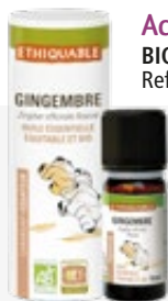
Aceite esencial JENGIBRE 10 ml BIO JUSTO 100% puro y natural. Ref. 80808103