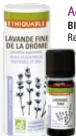
Aceite esencial LAVANDA FINA 10 ml BIO JUSTO 100% puro y natural. Ref. 80808105

El proyecto ORIBI , innovador en su enfoque, apoya el regreso a la tierra de las comunidades zulúes en torno al cultivo del árbol del té.