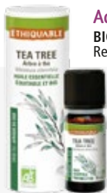
Aceite esencial ÁRBOL DE TÉ 10 ml. BIO JUSTO 100% puro y natural. Ref. 80808104