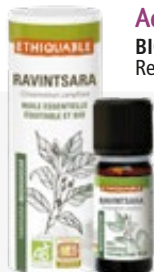
Aceite esencial RAVINTSARA 10 ml BIO JUSTO 100% puro y natural. Ref. 80808102

El proyecto de aceite esencial proporciona ingresos al tiempo que preserva su cultura y naturaleza por su alto valor agregado, al lograr destilarse en origen.