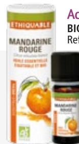
Aceite esencial MANDARINA ROJA 10 ml BIO JUSTO 100% puro y natural. Ref. 80808100