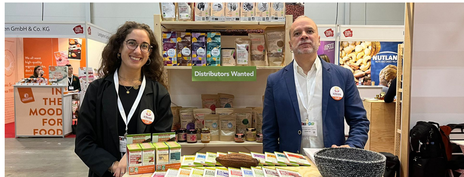
Nordic Organic Food en Estocolmo, Suecia.

Primera participación de IDEAS en esta feria. Celebrada en la ciudad sueca de Estocolmo, con gran asistencia de público profesional de muchos países europeos y de fuera de Europa.