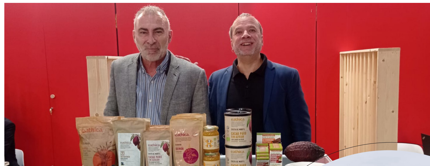
Feria Alimentaria en Barcelona.