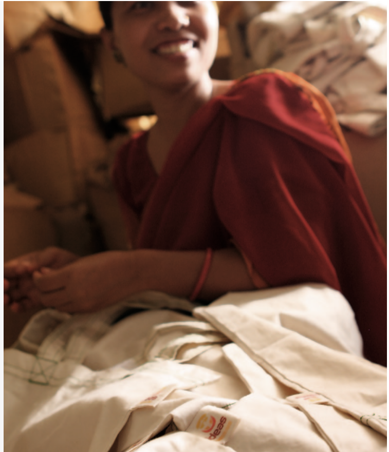
Bolsas de Comercio Justo confeccionadas por Corr the Jute (Bangladesh)

Existen ya varias iniciativas internacionales que promueven un consumo institucional crítico que exija el cumplimiento de unos estándares laborales mínimos. En 2002, la Campaña Ropa Limpia internacional ( www.cleanclothes.org ) lanzó la plataforma Clean Clothes Communities, con la intención de involucrar a las Administraciones Públicas en procesos de compra ética o responsable de ropa. En 2003 nació en los EUA el movimiento "Sweatfree" ( www.sweatfree.org ) para involucrar a las administraciones públicas en la lucha contra la explotación laboral en el textil. La primera experiencia al respecto en España fue la "Xarxa Catalana per la Compra Pública Ètica". Esta iniciativa impulsada por SETEM agrupa a administraciones locales y autonómicas catalanas que comprometidas en la introducción de criterios éticos en sus compras de ropa.